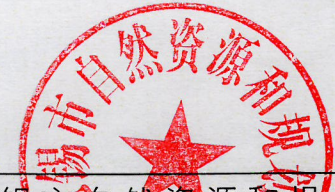
无锡市自然资源和规划局地块规划图